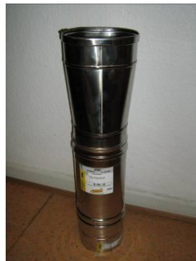
Adaptateur tubage ovale