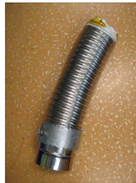
Conduit double peau