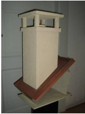
Sortie de toiture