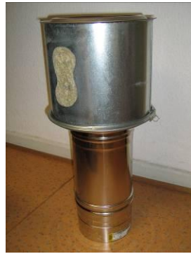
Conduit isolé + réduction conique