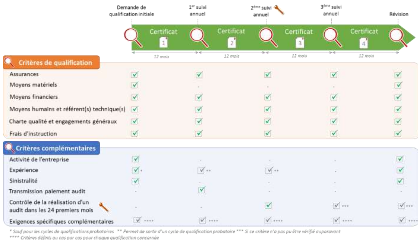
Fig. 03 - Schéma général des critères de qualification