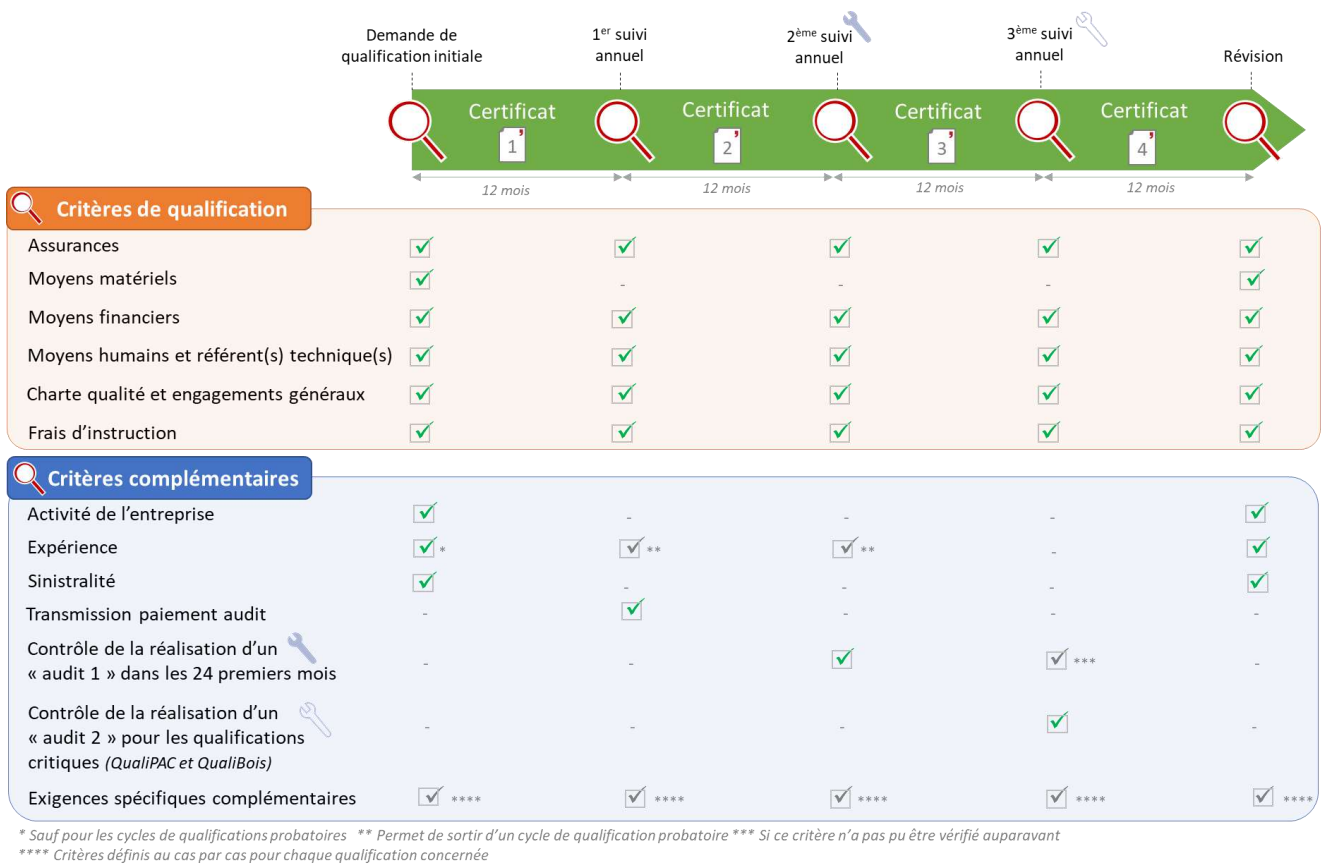
Fig. 03 - Schéma général des critères de qualification